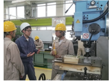
教育支援活動 Educational Support Activity

科学の発展において優れた実験技術と応用能力を身につけた技術者の役割は重要です。教育研究支援室ではこれを踏まえ、未来を担う技術者の育成や新たな技術を生み出すロボコンに代表される各種コンテストに対し、培った技術と専門知識をもって実践的な教育支援を行っています。また、地域と連携した出前授業・青少年のための科学の祭典・産官学交流などへも支援を行い、身近な実験から新たな技術の創出まで幅広い内容の地域貢献を目指しています。