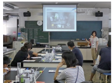
地域貢献活動 Regional Contribution Activity